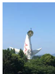
我々を見守る太陽の塔

最後に、全く関係ありませんが、3週間に1回は大阪に帰っているため、何かと目にするのある太陽の塔を御覧ください(写真左 2018年6月9日撮影)。実物を見るのにおすすめなのは日没で、怪しげに目が光ります(これについては実際に見てください)。ライブカメラで見ることできます(「ライブカメラ 万博記念公園」で検索。ただし今の所、画像はパラパラ)。論文執筆や書類仕事などで疲れた時におすすめです。癒やされることはありません。