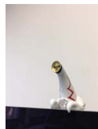
進捗を見守るコップのフチの太陽の塔