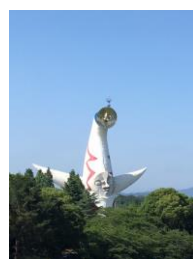
我々を見守る太陽の塔

最後に、全く関係ありませんが、3週間に1回は大阪に帰っているため、何かと目にするのある太陽の塔を御覧ください(写真左 2018年6月9日撮影)。実物を見るのにおすすめなのは日没で、怪しげに目が光ります(これについては実際に見てください)。ライブカメラで見られることもできます(「ライブカメラ 万博記念公園」で検索。ただし今の所、画像はパラパラ)。論文執筆や書類仕事などで疲れた時におすすめです。癒やされることはありません。