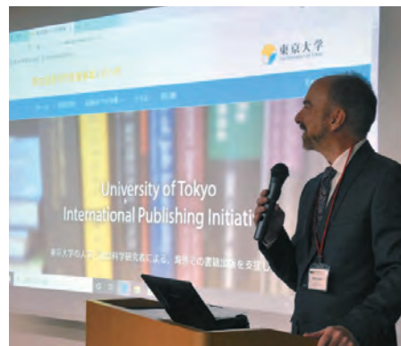
英文図書刊行支援事業キックオフシンポジウム UT-IPI Kick-off Symposium

これまでに、米国や英国の大学出版局からの編集者を招いてのシンポジウムを開催しました。この事業の支援の下、現在までに多くの企画が契約に到り、すでに刊行された本もあります。