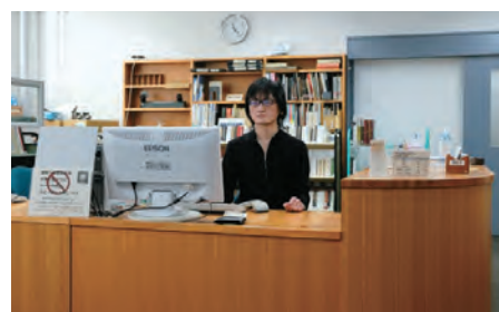
図書室カウンター ISS Library counter

These materials are available not only to the members of ISS and the University of Tokyo but also to outside researchers.