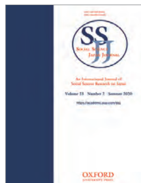
Social Science Japan Journal 表紙 Front cover of Social Science Japan Journal

またSSJJは、世界各国の著名な日本研究者約30名からなる国際編集委員会と、ヨーロッパ、北米、イスラエルを代表する4名の地域代表委員によって支えられており、論文の募集や投稿論文の評価への積極的な支援を受けています。