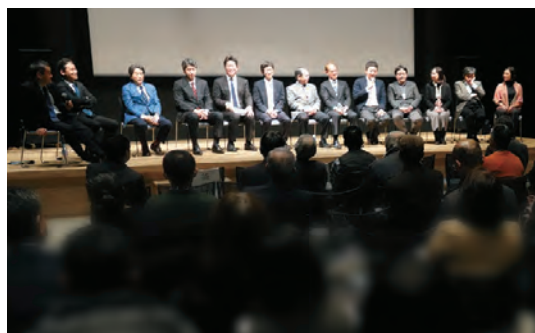
全所的プロジェクト研究「危機対応の社会科学」成果発表会 Presentation of the results of "Social Sciences of Crisis Thinking"

2021年より、社会科学研究の新たな全所的プロジェクト研究「社会科学のメソドロジー:事象や価値をどのように測るか」が発足しました。このプロジェクトは、AIやビッグデータによる方法的革新によって、社会科学がどのように変化しているかを再検討するものです。その際にとくに、多様な社会科学がCOVID-19などの研究を通じて、事象のみならず主観的な価値や選好をいかに「測る」かに注目します。プロジェクト期間は4年を予定しています。