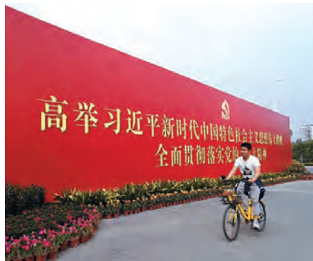
習近平政権のスローガンの前を走るシェアサイクル (深圳市前海新区にて撮影)

学部生や大学院生向けの授業や社会人向けの講座を開催し、その内容を書籍として刊行しています。また、英語や中国語での論文刊行や国際ワークショップの開催を通じて中国や他国の研究者との連携を深め、現代中国研究の国際的なハブとして活動しています。