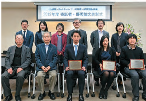
2019年寄託者・優秀論文 表彰式 Awards of 2019 for Depositors and Excellent Papers using SSJDA's Data