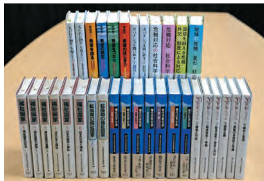
「全所的プロジェクト研究」刊行物 Institute-wide joint research project publications

全所的プロジェクト研究は、日本と世界が直面している重要課題を研究テーマとして設定し、所内外の多くの研究者や実践家の参加を得て、3年から5年の研究期間をかけて研究を進め、成果を刊行します。1964年開始以来、これまでに取り組んできたテーマは、「基本的人権」、「戦後改革」、「ファシズム期の国家と社会」、「福祉国家」、「転換期の福祉国家」、「現代日本社会」、「20世紀システム」、「失われた10年？ 90年代日本をとらえなおす」、「地域主義比較」、「希望の社会科学」、「ガバナンスを問い直す」、そして「危機対応の社会科学」でした。それらの成果はいずれも東京大学出版会から数巻におよぶ書物として刊行されています。