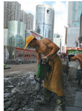
建設工事現場の労働者 (深圳市華強北にて撮影)

A biker riding a shared bike in front of a Xi Jinping's slogan (photo taken in Qianhai District, Shenzhen)