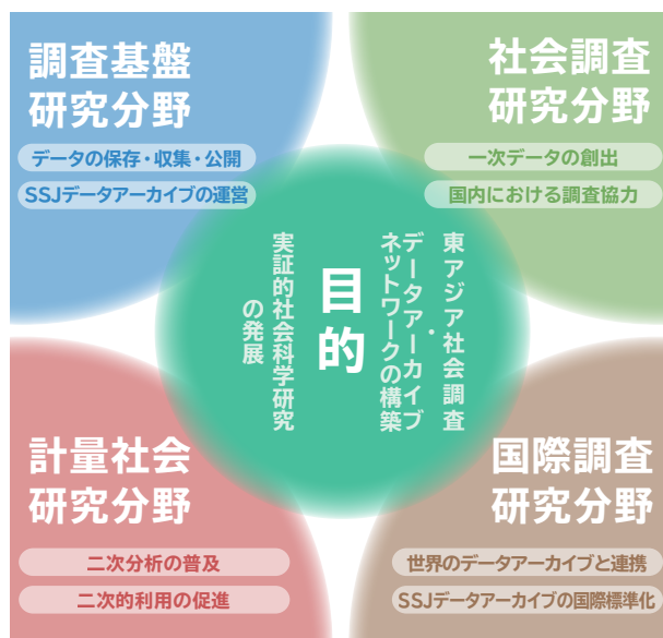
CSRDA 分野構成 The Composition of CSRDA

The Center for Social Research and Data Archives (CSRDA) comprises four groups: the Research Infrastructure Group, the Social Survey Research Group, the Quantitative Social Research Group, and the International Survey Research Group. The Research Infrastructure Group works with a variety of research agencies to gather large amounts of primary data used in the SSJ Data Archive and make it available online for joint usage by universities, research institutions, and researchers in Japan and beyond. The Social Survey Research Group conducts the Japanese Life Course Panel Survey (JLPS). The Quantitative Social Research Group, through its secondary analysis research workshops and quantitative analysis seminars, is able to promote cooperative research and train young researchers. The International Survey Research Group establishes and maintains relationships with data archives throughout the world, and is working to bring the SSJ Data Archive in line with international standards. Through these activities, CSRDA intends to take a leading role in the development of empirical social science research in Japan, and in the construction of a network of East Asia social surveys and data archives.