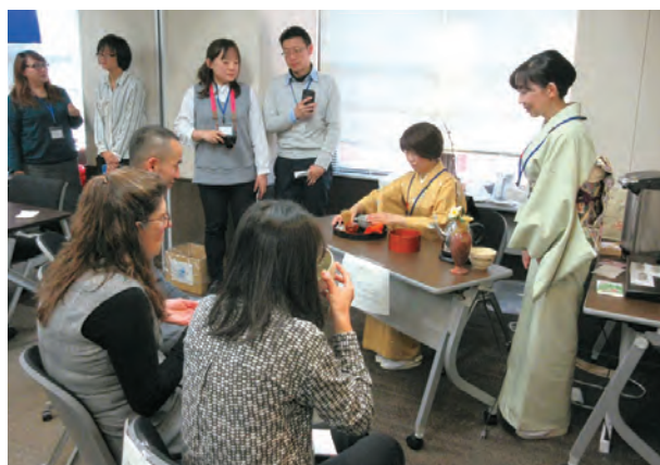
国際ワークショップの休憩時間でのお茶会の様子 Tea ceremony at break time during an international workshop